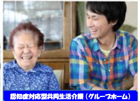
認知症対応型共同生活介護（グループホーム）